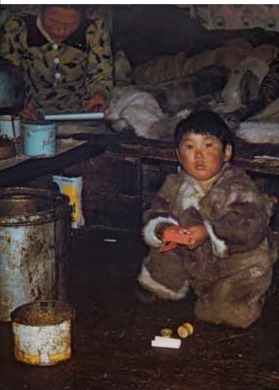
Inneres eines heutigen Iglu. Die Mauern sind aus Stein und Torf, die Ummantelung aus Schnee. Die Innenwände bestehen aus Sperrholz, die Schlafplattform aus Holz.

Die Wohngebiete der heutigen Eskimos, die sich selbst als «Inuit», als «Menschen», bezeichnen, erstrecken sich über etwa 10'000 Kilometer von Ostsibirien über die arktischen Teile Nordamerikas, Alaska und Kanada bis nach Grönland. Der Ursprung der Inuit sowie die Entstehung und Ausbreitung ihrer Kultur liegen noch weithin im Dunkeln. Die ältesten Spuren menschlichen Lebens in der Arktis lassen sich auf etwa 5000 Jahre zurückdatieren. Die für die Inuit charakteristischen Lebensformen entstanden in der sogenannten Thule-Kultur, die wahrscheinlich um Christi Geburt entstand und ihren Höhepunkt um das Jahr 1000 erreichte.