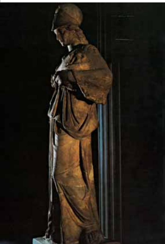
Statue der Athene, die im 4. Jahrhundert vor Christus in Griechenland entstanden ist.

Zuallererst war Chaos da. Es war der leere Raum. Und dann war da Gaia, die Urmutter Erde. Und dann war da Tartaros, der Abgrund. Und dann war da Eros, die Kraft der Liebe. Eros wirkt auf ewig. Und aus dem Chaos ging Dunkel hervor. Und dann erschien das Licht. Und Gaia erzeugte Himmel und Erde.