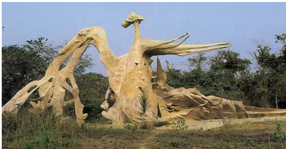
Heiligtum des Obatala, der von Olorun die Gabe erhielt, Menschen aus Ton zu modellieren, denen der höchste Gott anschliessend Atem einhauchte (Ill. aus «Afrika. Bildatlas der Weltkulturen». Augsburg: Bechtermünz 1998).

Die Yoruba, ein Volk von etwa 10 bis 15 Millionen Menschen, leben in Südwestnigeria und im südöstlichen Teil von Benin. Sie sind in einer Reihe von Königreichen politisch organisiert, die nach der Idealvorstellung aus einer Stadt und deren urbar gemachtem Umland bestehen. Die Religion der Yoruba basiert auf einer vierstufigen Rangordnung: Olorun, der Besitzer des Himmels, nimmt den Vorsitz ein. Ihm unterstehen untergeordnete Götter, dann folgen vergöttlichte Ahnen, und den Schluss der Hierarchie bilden Geister, die mit Naturphänomenen in Verbindung stehen.