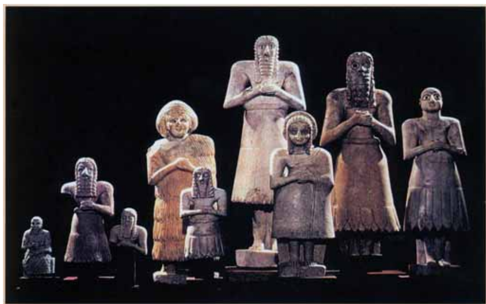
Betonde aus Sumer. Statuen aus der 1. Hälfte des 3. Jahrtausends vor Christus.

Teil einer Keilschrifttafel aus der Periode um 2600 v. Chr. Die Schrift wurde mittels Schilfgriffel in die feuchte Tontafel eingeritzt. Anschliessend wurde die Tafel getrocknet. Wichtige Dokumente wurden zusätzlich gebrannt.