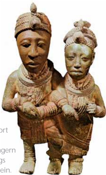
Königliches Paar aus Ife, welches im 9. Jahrhundert gegründet wurde und bis zum 15. Jahrhundert Hauptstadt des Volkes der Yoruba war. Bronzefigur aus dem 12. Jahrhundert.

Ursprung. Frankfurt a.M.: Museum für Völkerkunde 1987