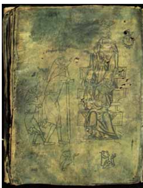
Der legendäre Schwedenkönig Gylfi, verkleidet als müder Wanderer, befragt Odin über den Ursprung der Welt. Illustration aus einem Edda-Manuskript aus dem 14. Jahrhundert.

Ziel der Fahrten der aus Skandinavien stammenden Wikinger oder Nordgermanen waren Handelspartner und Siedlungsgebiete; sie dienten aber auch dem Raub und der Brandschatzung.