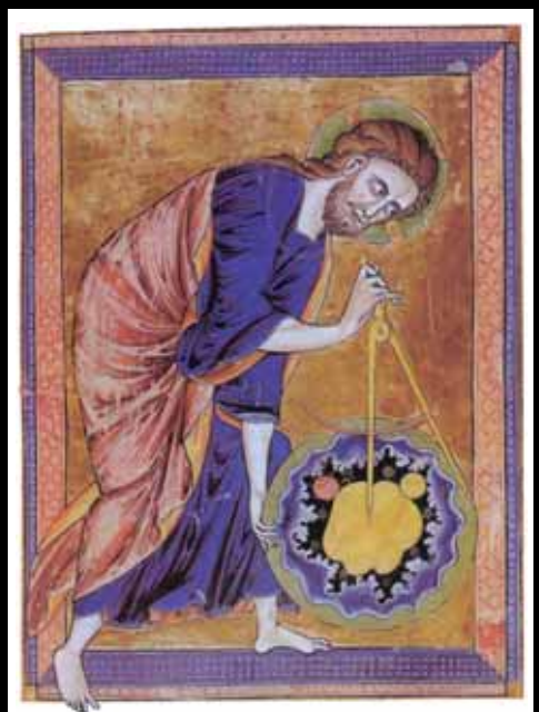
Die Erschaffung der Welt. Titelblatt der «Bible moralisée» (Frankreich, um 1270)

Bild oben: Michael Benson «Jenseits des blauen Planeten» (München: Knesebeck 2004)