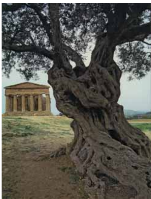
Tempel unterhalb von Delphi im Golf von Korinth (Ill. aus «Olivengeflüster. Von der Magie eines göttlichen Baumes». München: Artea 2002)

Die Griechen glaubten, die Spitze des Olymp, ihres höchsten Bergmassivs, diene den Göttern als Wohnsitz. Ihre Tempel errichteten sie häufig an Orten, die sich durch landschaftliche Schönheit auszeichneten. Viele ihrer Gottheiten waren eng mit der Natur verbunden – mit Flüssen und Bäumen, Feldfrüchten, Weintrauben oder mit Wettererscheinungen. In Blitz und Donner erkannten sie die Waffen des Götterkönigs Zeus. Um ungefähr 700 vor Christus schrieb Hesiod seine Theogonie in 1022 Versen, in denen er die Entstehung der Welt und den Ursprung der Götter beschreibt.